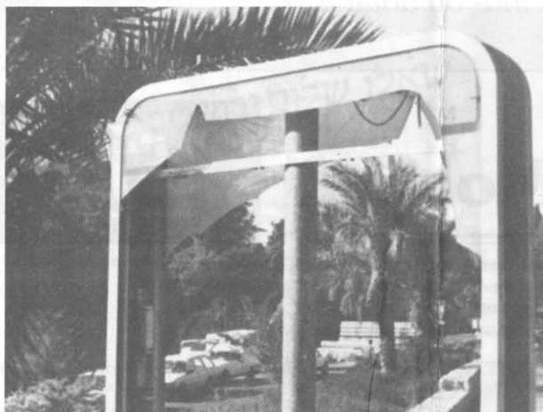
»Bed om Jerusalems fred« – et smadret bykort uden for Damaskus-porten.

Selvom udflytningen var begyndt før 1890'erne, var det i dette tidsrum, at der kom til at leve flere jøder uden for muren end indenfor. Det gamle Jerusalem beholdt sin status som den hellige by. De vigtigste religiøse institutioner lå her. Men de moderne institutioner blev placeret uden for muren.