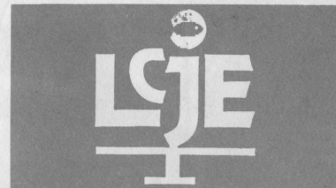
Logoet for Lausanne-rådet for jødemission.